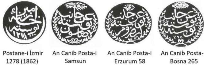
Resim 1: Prefilatelik Dönem Posta Mühür Örnekleri